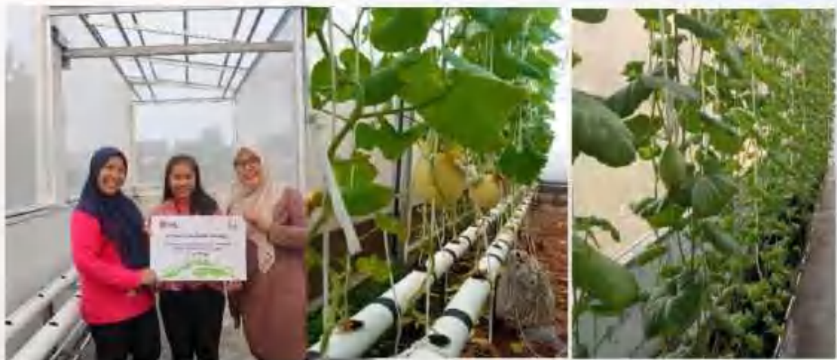
[Gambar/ Picture 5. Penyelenggaraan TJSI bekerjasama dengan Yayasan Pulo Kambing/ Implementation of TJSI collaborated with Pulo Kambing Foundation]

farming. This was the third year that the Company has collaborated with Pulo Kambing Foundation in the area of social responsibility, where in previous years, the Company has provided support in the form of motorcycles and 3-wheeled vehicles for operational activities in the collection of household waste to be recycled by the Foundation. In addition, the company is also a participant in the education and financial literacy of the public, in this case students.