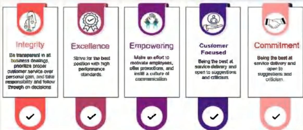
[Gambar/Picture 1. Nilai Perusahaan/Corporate Value]

Sustainability Values: The Company aims to contribute to the sustainable development and prosperity of the Indonesian economy, industry and society in general, and the communities surrounding the Company in particular.