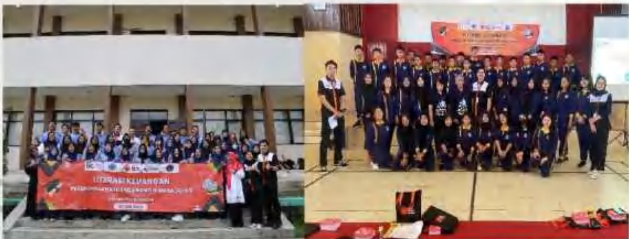
[Gambar/ Picture 6. Kegiatan Literasi Keuangan di SMKN 4 Kuningan, Jawa Barat dan SMKN 4 Palangkaraya, Kalimantan Tengah/ Financial Literacy activities at SMKN 4 Kuningan, West Java and SMKN 4 Palangkaraya, Central Kalimantan]