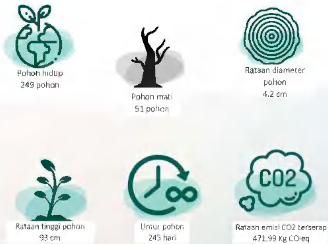
[Gambar/ Picture 9. Hasil Pemantauan Perkembangan Pohon Mangrove Dan Serapan Karbon/ Results of Monitoring Mangrove Tree Development and Carbon Sequestration]

d. Jumlah dan intensitas emisi yang dihasilkan berdasarkan jenisnya;