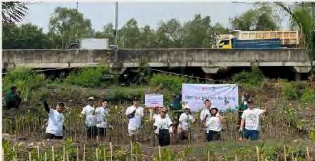
[Gambar/ Picture 7: TJSI Penanaman Mangrove di Kawasan Ekowisata PIK/ CSR Activities Mangrove Planting in the PIK Ecotourism Area]

The widespread problem of global warming also gave the company the awareness to be directly involved in the mission of saving the environment by participating in the planting of mangroves in the mangrove ecotourism area of Pantai Indah Kapuk (PIK).